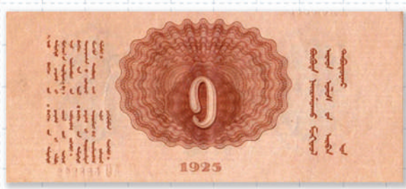
1925 оны 1 төгрөгийн дэвсгэрт

1925 онд мөнгөний шинэчлэл хийх тухай түүхэн тогтоол гарч анхны 1,3,5,10,25,50,100-тын дэвсгэртээс бүрдсэн нийт 200.100 /хоёр зуун мянга нэг зуу/ төгрөгийг гүйлгээнд оруулж байсан.