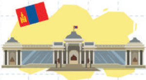
1 САРЫН 13 МОНГОЛ УЛС

Жишээ нь: АНУ-ын хувьд жил бүрийн 9 дүгээр сарын 17-ны өдөр, ОХУ-д 12 дугаар сарын 12-ны өдөр, Япон улс 5 дугаар сарын 3-ны өдрийг Үндсэн хуулийн өдөр болгон тэмдэглэдэг.