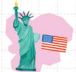
9 САРЫН 17 АМЕРИКИЙН НЭГДСЭН УЛС