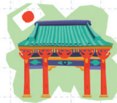
5 САРЫН 3 ЯПОН УЛС